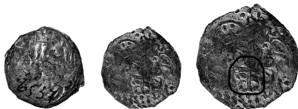
Фото 10. Борщевський скарб (НМІУ. Нумізматична колекція – AR-6537/14).

Фото 9. Борщевський скарб (НМІУ. Нумізматична колекція – AR-6537/10).